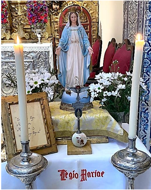
Curia Virgen de los Reyes – Sevilla