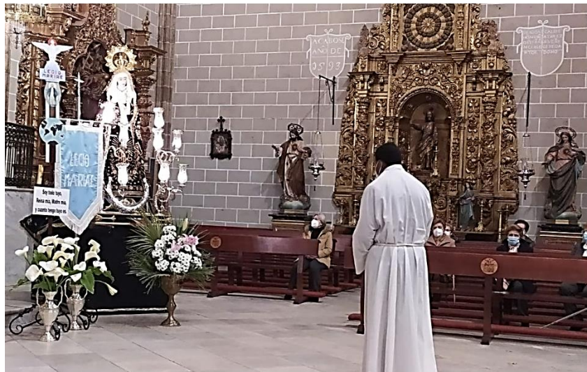
Curia Virgen Fiel de la Candelaria – Fuente del Maestre