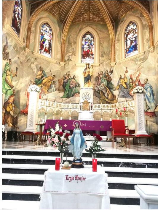
Comitium Ntra. Sra. de la Vega – Salamanca