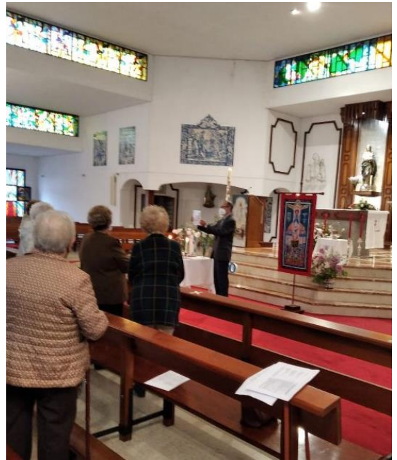
Comitium Ntra. Sra. de la Soledad – Badajoz