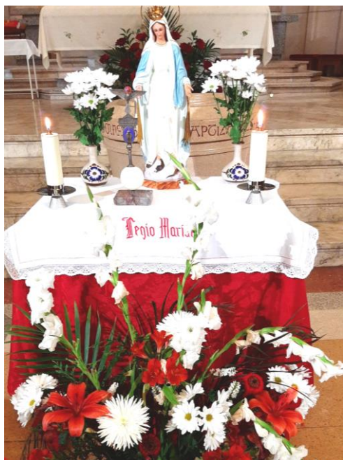
Curia Senatus - Madrid

Esta pertenencia y alianza de amor, nos lleva a esa realidad tan profunda de la entrega cotidiana, diaria. Así renovamos año tras año nuestra pertenencia a María, para ser suyos y nuestra alianza de amor con Ella para hacerlo todo como Ella lo hace. Y en esa entrega cotidiana imitamos a María que sigue a Jesús para estar con Él hasta el pie de la Cruz.