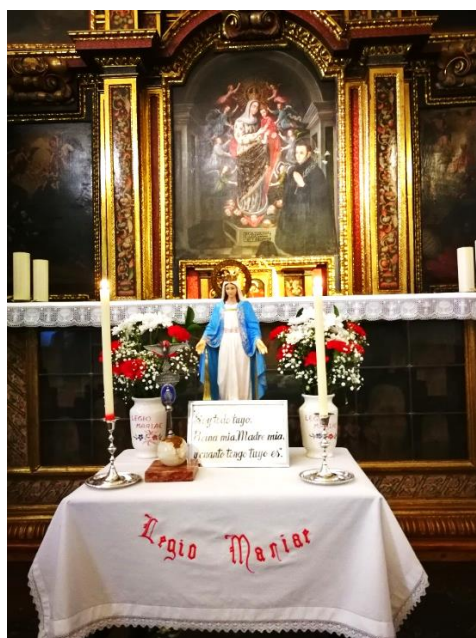
Curia Ntra. Sra. del Pilar - Valladolid