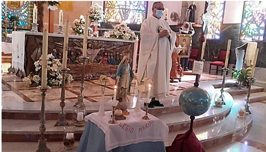
Curia Ntra. Sra. del Carmen – Tenerife